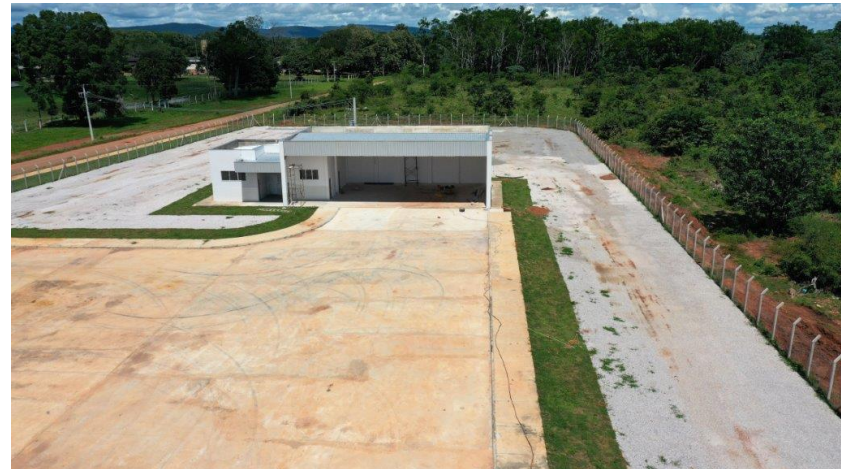
Fig. 10: Área de apoio ao motorista.