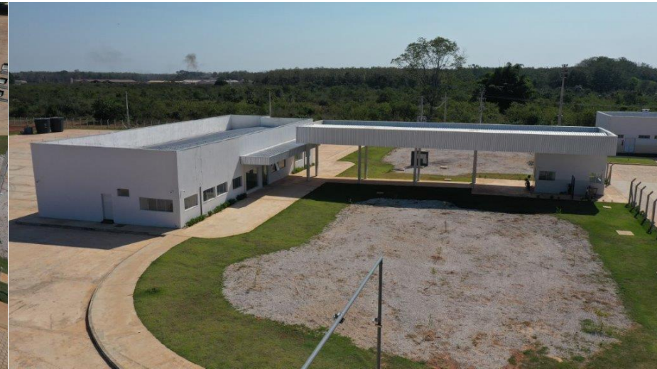
Fig.3: Gate de controle de pedestres e acesso ao prédio da Receita Federal.