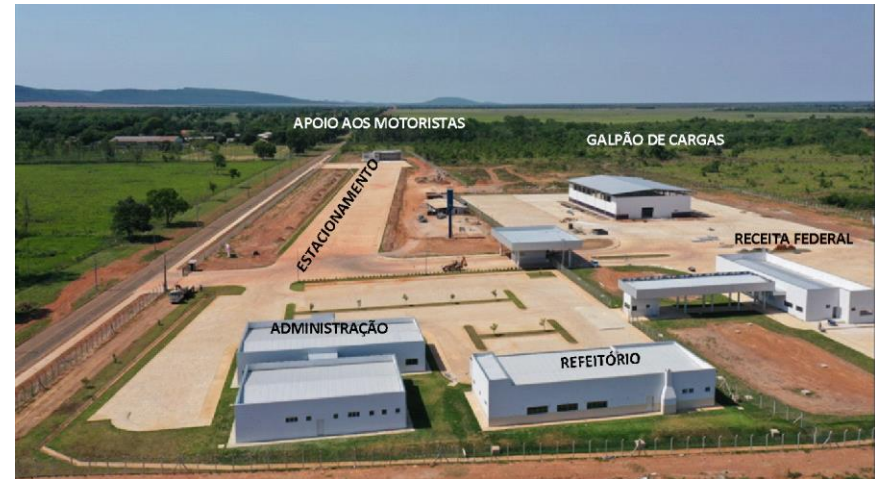
Fig. 1: Visão Geral da ZPE

* Meta Prevista Atualizada (1ºSem/2023) = PTA/LOA Original +/- créditos adicionais