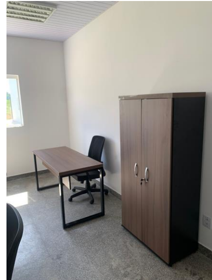
Fig. 11, 12, 13: Salas mobiliadas pela Administradora da Zona de Processamento e Exportação de Cáceres - AZPEC.

* Meta Prevista Atualizada (1ºSem/2023) = PTA/LOA Original +/- créditos adicionais