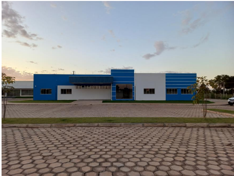
Fig. 7: Prédio administrativo.