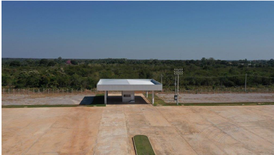
Fig. 4: Gate secundário de acesso de veículos para área industrial.