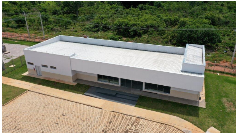
Fig. 9: Prédio do restaurante.