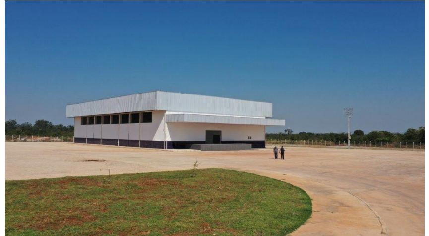
Fig. 6: Galpão de cargas vista frontal.