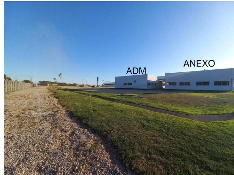
Fig. 8: Prédio anexo ao bloco administrativo.

* Meta Prevista Atualizada (1ºSem/2023) = PTA/LOA Original +/- créditos adicionais