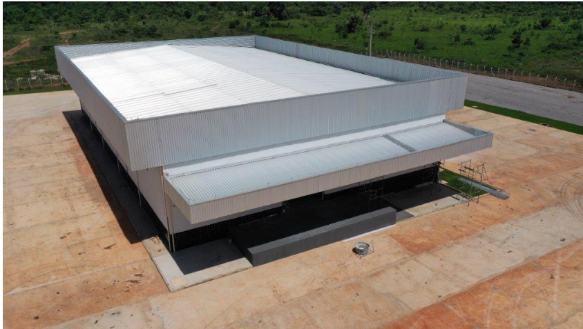
Fig. 5: Galpão de cargas vista aérea.