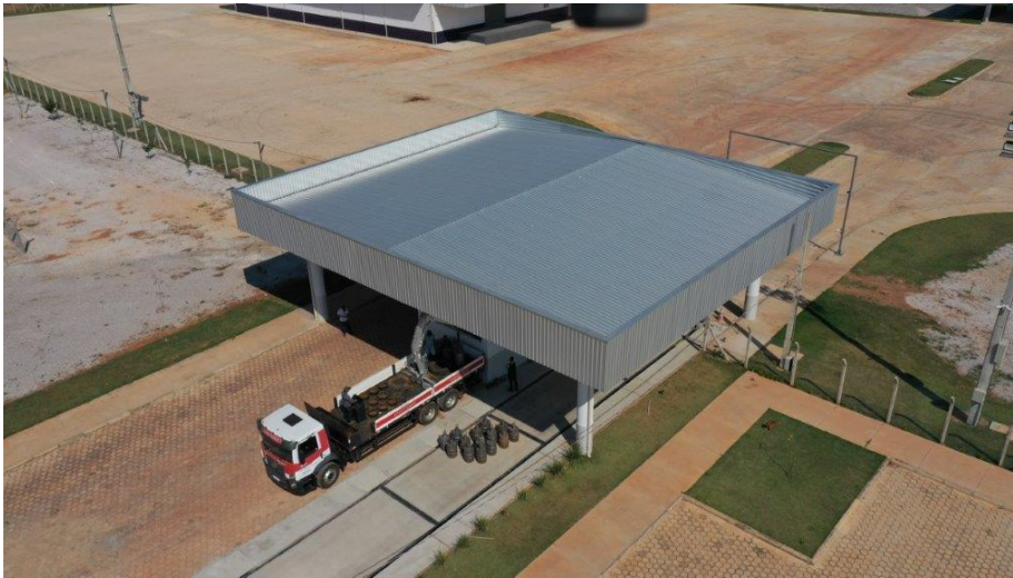
Fig.2: Gate Principal de acesso de veículos.