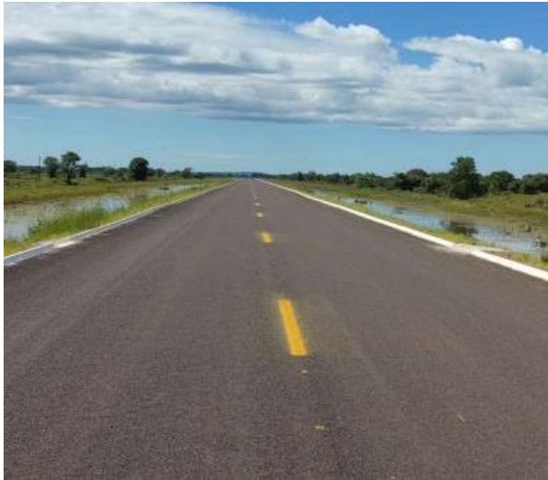
Pavimentação Rodovia MT-326 (I.C. 242/2013)