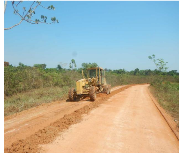
Manutenção de Rodovia Não Pavimentada (MT-208)