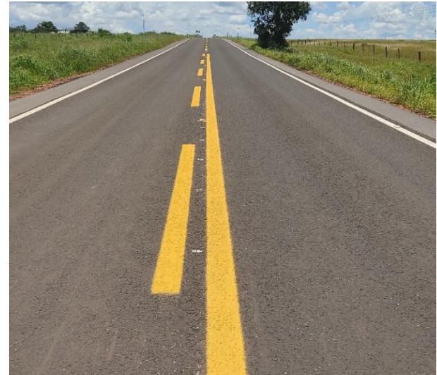
Restauração Rodovia MT-240/160 (I.C. 350/2014)