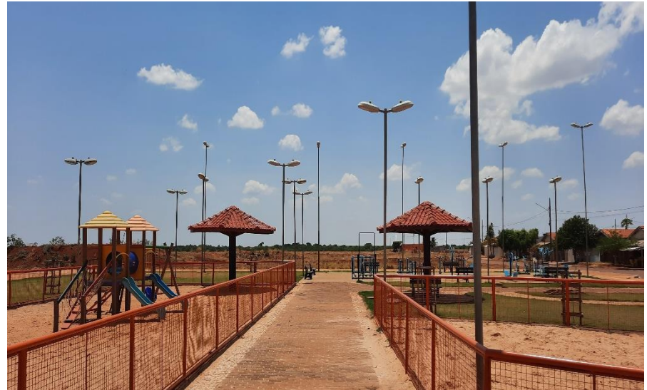
Construção da Praça Recreativa no Bairro Jardim Bem Viver, no Município de Santo Antônio do Leste – Conv. 104/2013