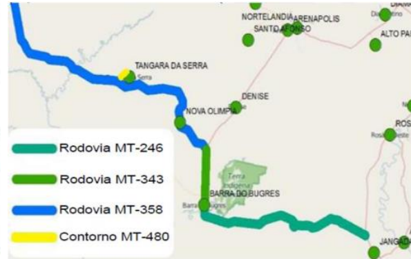
VIA BRASIL MT-246

Tangará da Serra: Trechos das Rodovias MT 246, MT 343, MT 358 e MT 480