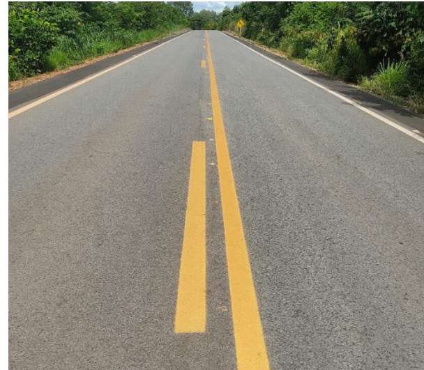
Restauração Rodovia MT-240 (I.C. 349/2014)