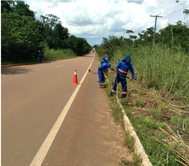
Manutenção de Rodovia Pavimentada (MT-423)