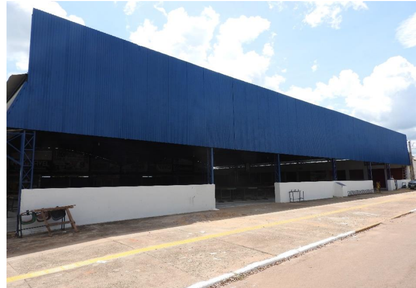
Ampliação e Reforma da Feira de Mirassol D'Oeste – Conv. 038/2020