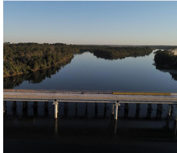
Ponte sobre o Rio Arinos IV (PT00660)