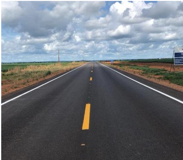
Pavimentação Rodovia MT-485 (I.C. 046/2020)