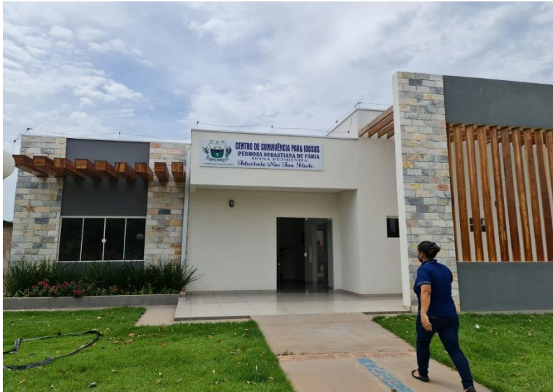
Construção do Centro de Atendimento ao Idoso no Município de Porto Estrela – Conv. 005/2014