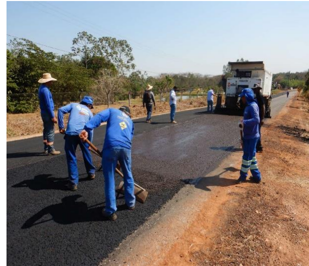
Manutenção de Rodovia Pavimentada (MT-250)