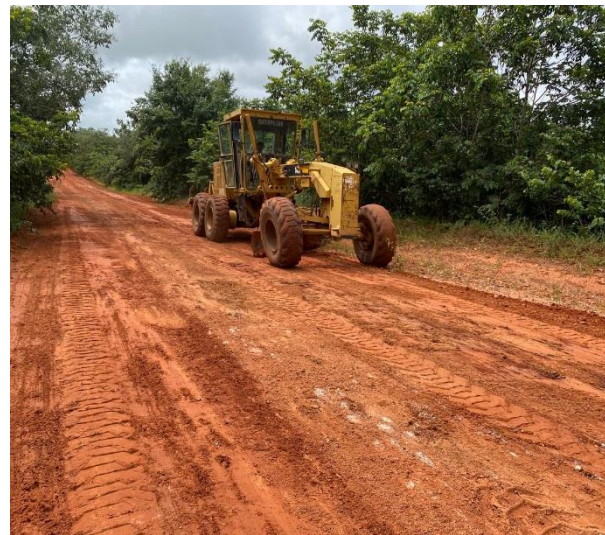
Manutenção de Rodovia Não Pavimentada (MT-270)