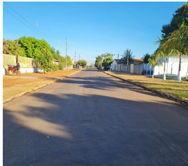
Prefeitura Municipal de Porto Alegre do Norte (Conv. 0354/2020)