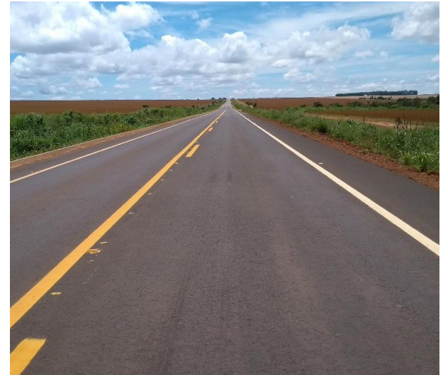
Pavimentação Rodovia MT-110 (I.C. 310/2014)