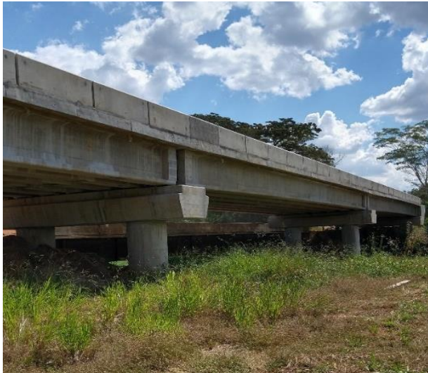
Ponte sobre o Rio Cabaçal (PT01207)