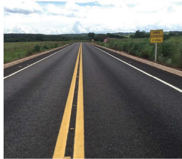
Pavimentação Rodovia MT-110 (I.C. 061/2017)