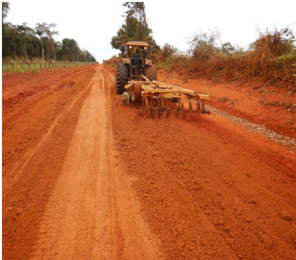
Manutenção de Rodovia Não Pavimentada (MT-208)