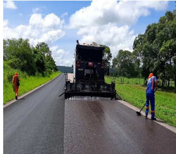
Manutenção de Rodovia Pavimentada (MT-248)