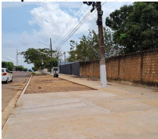
Prefeitura Municipal de Confresa (Conv. 0539/2020)