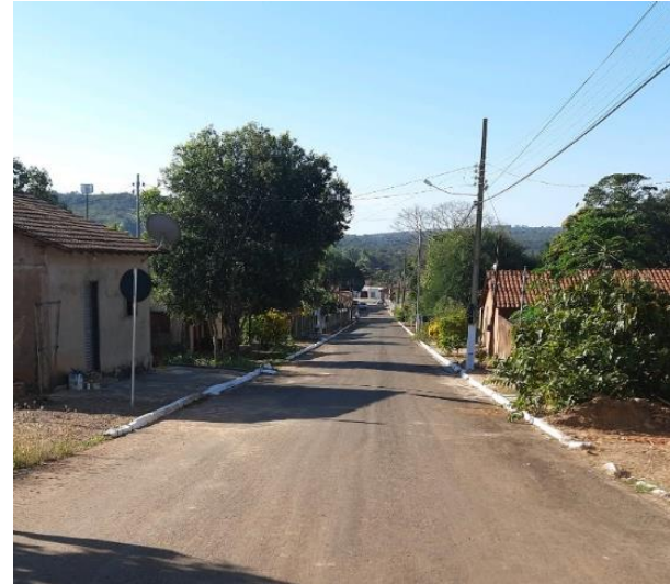
Prefeitura Municipal de Alto Taquari (Conv. 0299/2020)