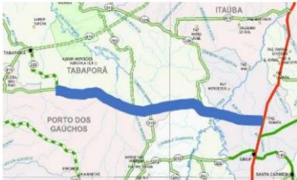
CONSÓRCIO VIA NORTE SUL

Tabaporã, Rodovia MT 220, Trecho: Entr. BR 163 (Sinop) – Entr. MT 410 (p/ Tabaporã)