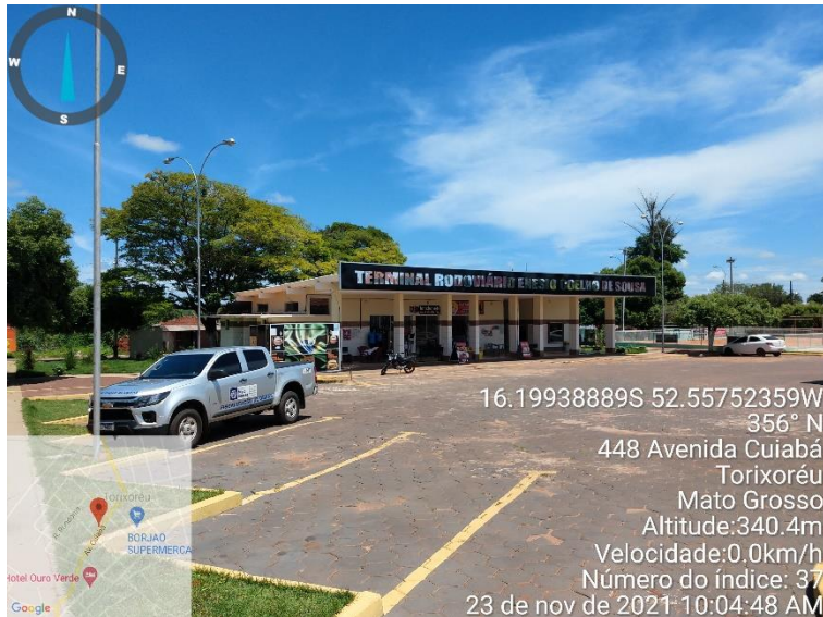
Construção do Terminal Rodoviário no Município de Torixoreu MT – Conv. 095/2013