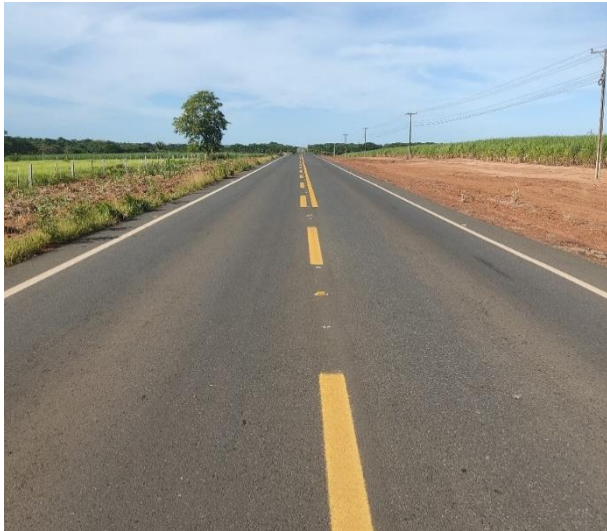
Restauração Rodovia MT-343 (I.C. 013/2019)