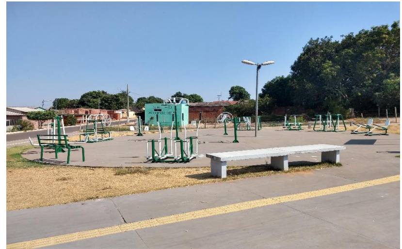
Instalação de academia ao ar livre no município de Alto Araguaia – Conv 123/2013