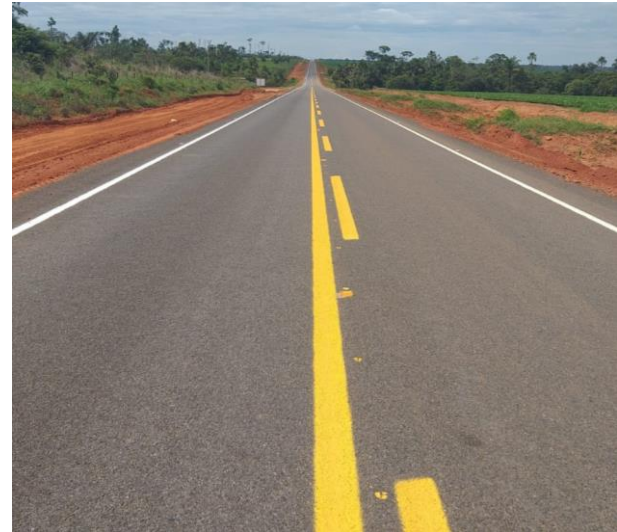
Pavimentação Rodovia MT-423 (I.C. 036/2020)