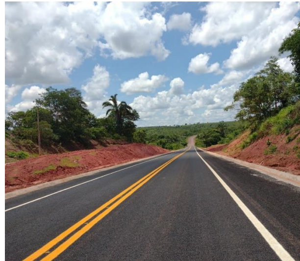
Pavimentação Rodovia MT-343 (I.C. 041/2014)