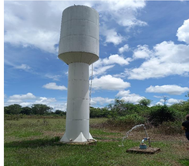
Construção do poço e reservatório de água do Município de Denise – 089/2013