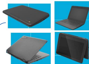
Aquisição de CHROMEBOOK e GABINETE DE RECARGA