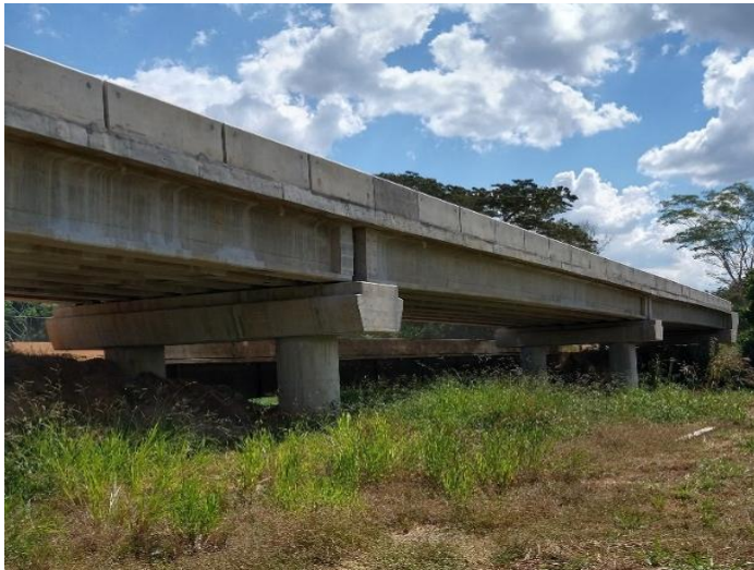
Ponte sobre o Rio Cabaçal (PT01207)