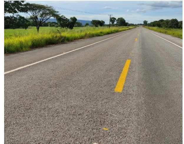
Pavimentação Rodovia MT-343 (I.C. 041/2014)