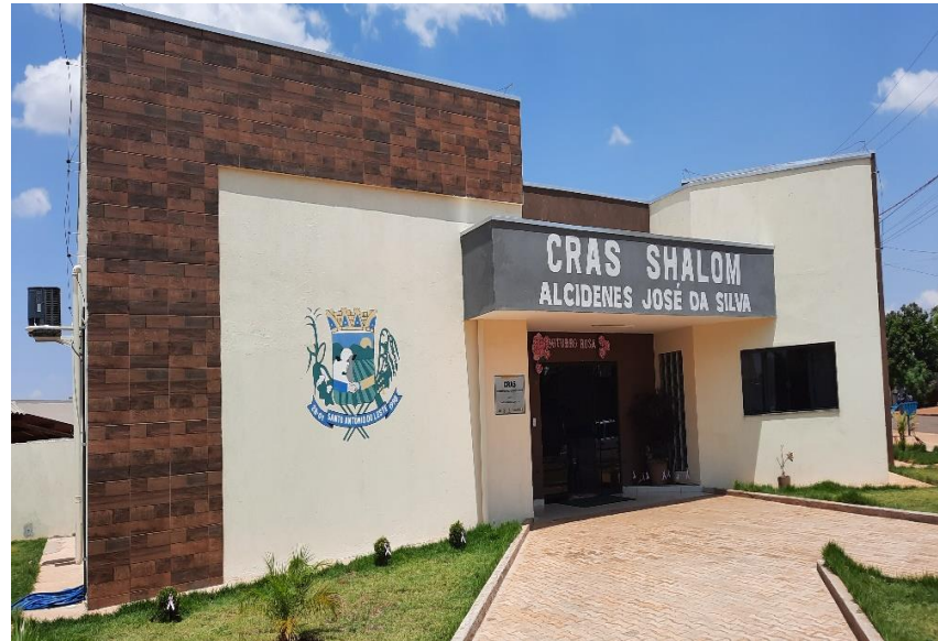
Construção do CRAS no município de Santo Antônio do Leste – Conv. 103/2013