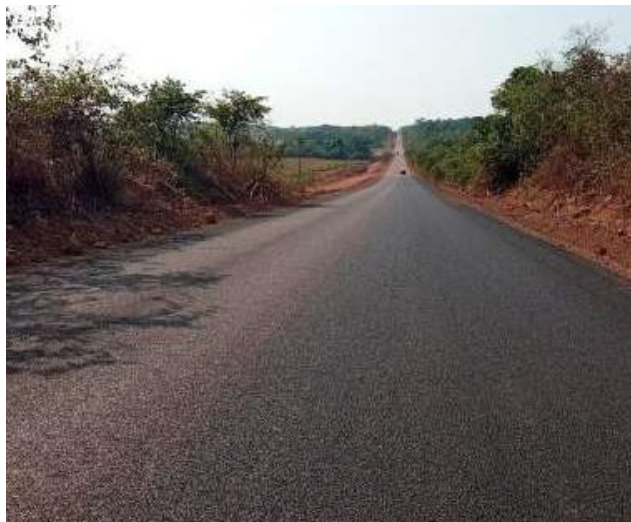
Pavimentação Rodovia MT-320 (I.C. 048/2021)