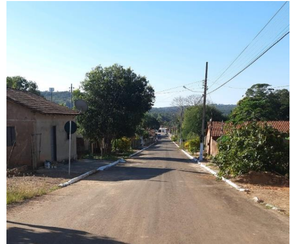
Prefeitura Municipal de Alto Taquari (Conv. 0299/2020)