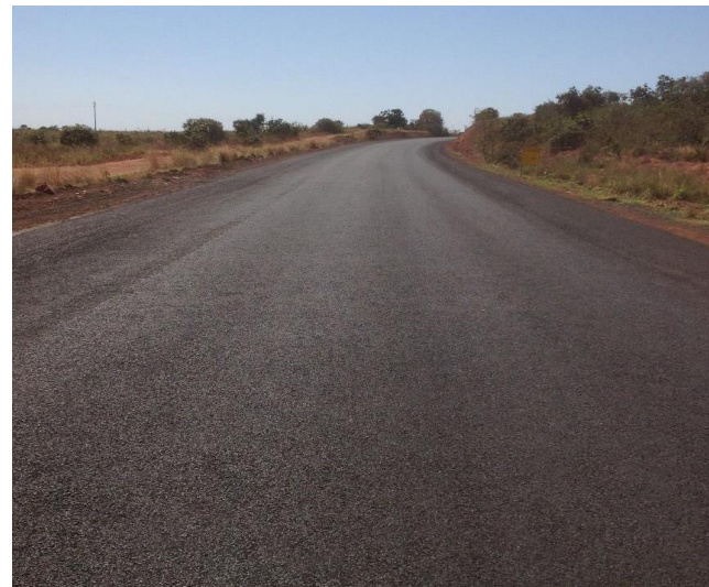
Pavimentação Rodovia MT-100 (I.C. 053/2020)