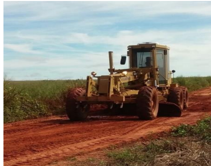
Manutenção de Rodovia Não Pavimentada (MT-471)