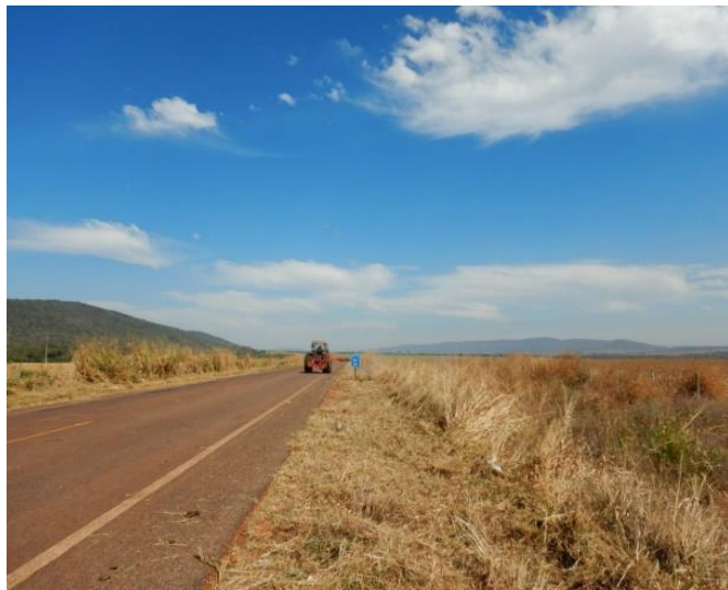
Manutenção de Rodovia Pavimentada (MT-473)