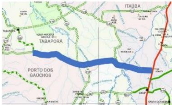
CONSÓRCIO VIA NORTE SUL

Tabaporã, Rodovia MT 220, Trecho: Entr. BR 163 (Sinop) – Entr. MT 410 (p/ Tabaporã)