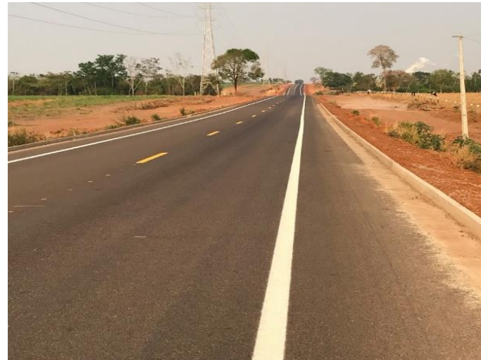
Pavimentação Rodovia MT-250 (I.C. 030/2020)