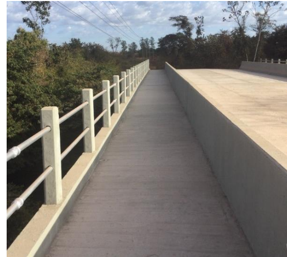
Ponte sobre o Rio Bandeira (PT01369)