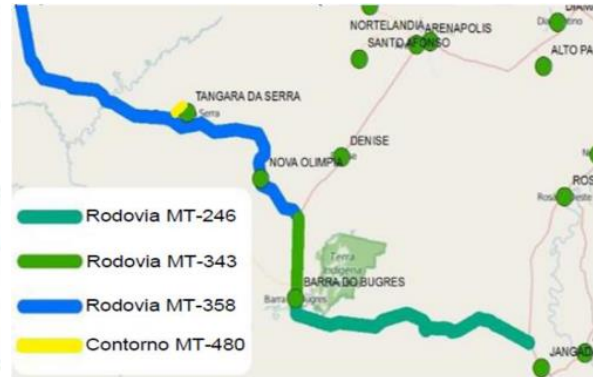
VIA BRASIL MT-246

Tangará da Serra: Trechos das Rodovias MT 246, MT 343, MT 358 e MT 480