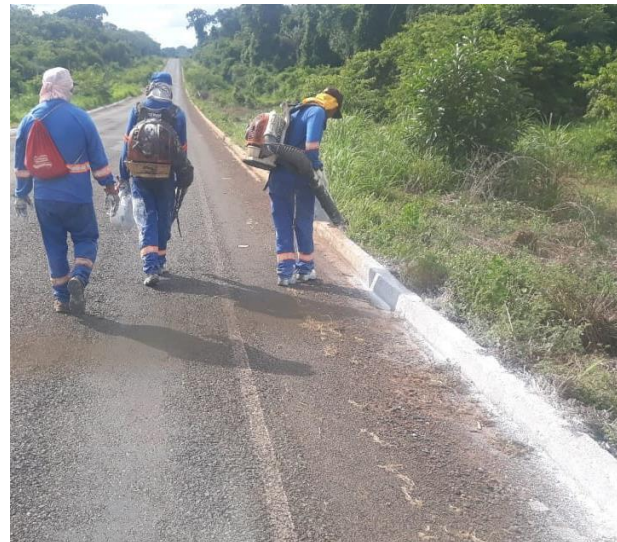
Manutenção de Rodovia Pavimentada (MT-170)