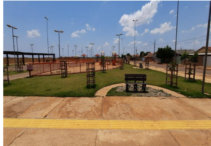
Construção da praça recreativa no bairro Jardim Bem Viver no município de Santo Antônio do Leste – Conv. 104/2013