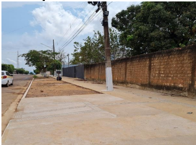
Prefeitura Municipal de Confresa (Conv. 0539/2020)