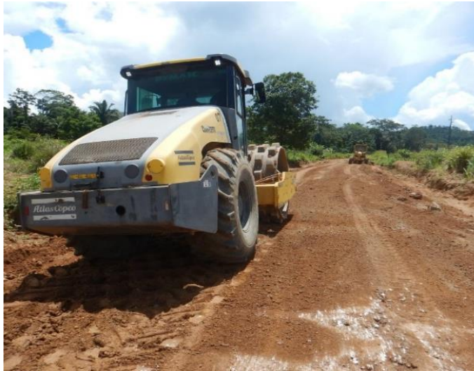
Manutenção de Rodovia Não Pavimentada (MT-208)