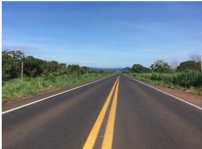
Restauração Rodovia MT-246 (I.C. 383/2014)