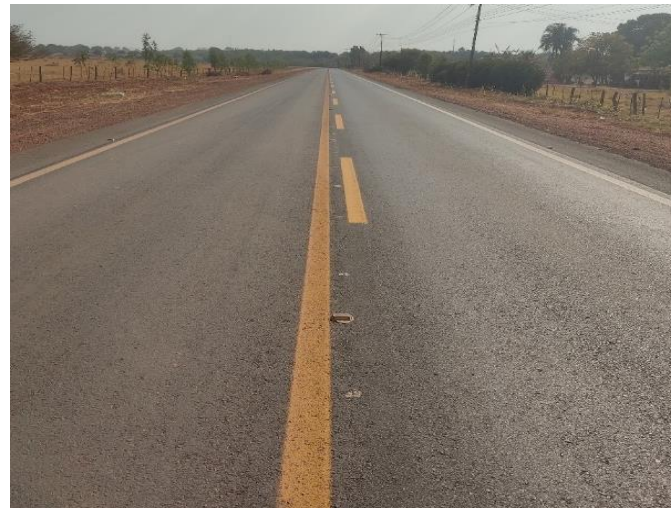
Restauração Rodovia MT-343 (I.C. 013/2019)