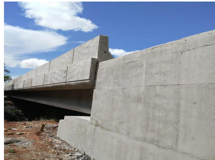
Ponte sobre o Rio Preto (PT02499)