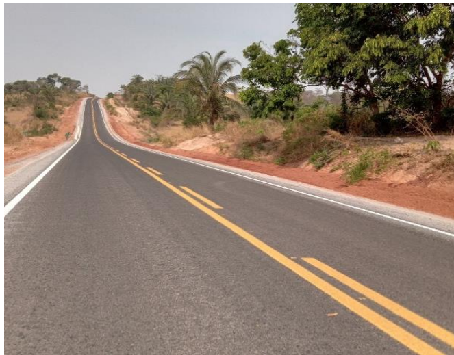
Pavimentação Rodovia MT-352 (I.C. 011/2020)