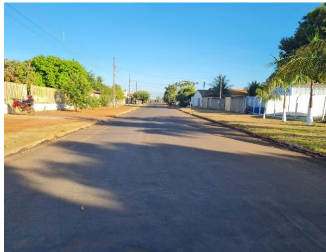
Prefeitura Municipal de Porto Alegre do Norte (Conv. 0354/2020)