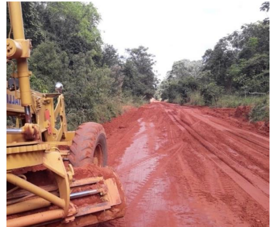
Manutenção de Rodovia Não Pavimentada (MT-370)