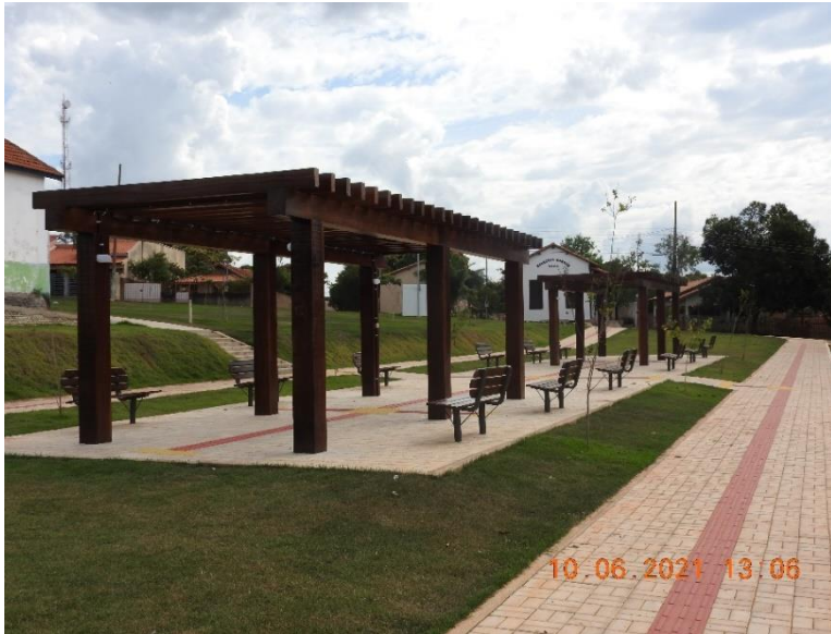
Construção de praça Marechal Rondon no município de Porto Esperidião – Conv. 17/2020