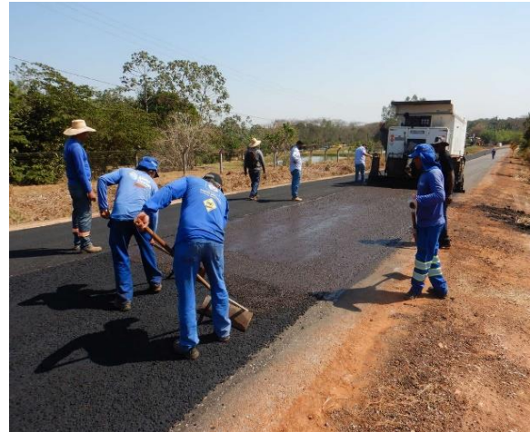
Manutenção de Rodovia Pavimentada (MT-250)