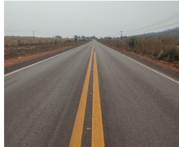
Restauração Rodovia MT-240 (I.C. 349/2014)