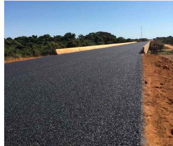
Pavimentação Rodovia MT-326 (I.C. 247/2013)