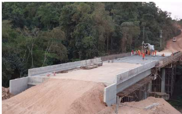
Rio Finca faca (MT-020/Nova Brasilândia)