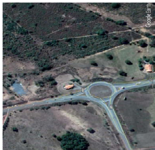
MT 010 Cuiabá a Rosário Oeste