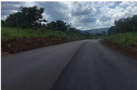
MT-246 (Jangada-Barra do Bugres)