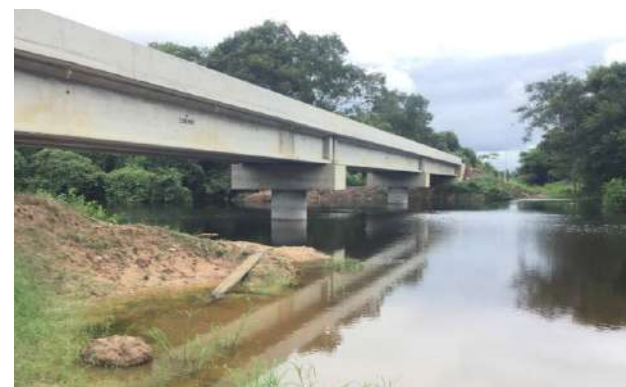
Rio Cassange (MT-060/Transpantaneira)