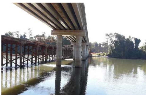
Rio Arinos III (MT-488/Tapurah)