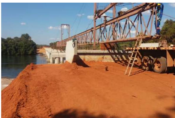
Rio Sangue I (MT-242/Brasnorte)