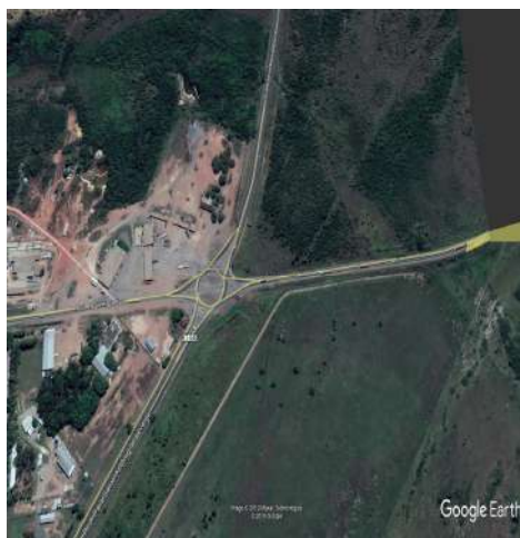
MT 040 Cuiabá a Sto. Antônio do Leverger