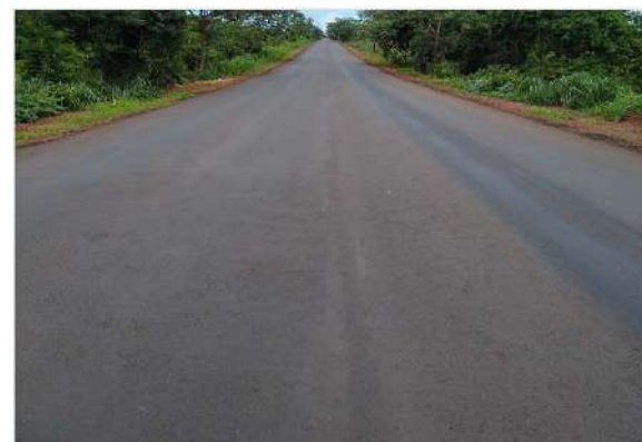
MT-358 (Tangará da Serra-Itanorte)