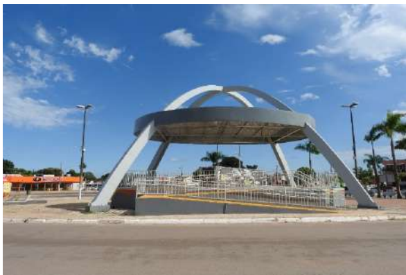
Praça Pública (Mirassol D'Oeste)