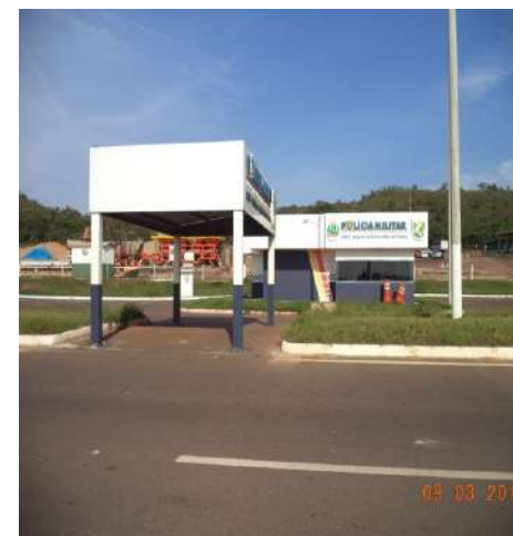
MT 130 Primavera do Leste a Rondonópolis