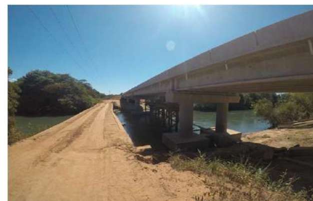
Rio Tartaruga (MT-423-Cláudia)