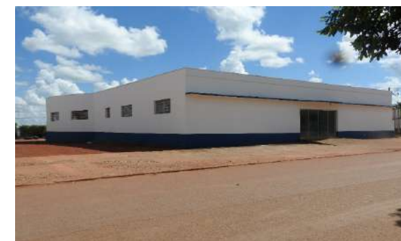
Centro Multiuso (Guarantã do Norte)