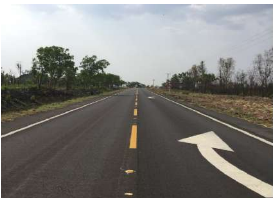
MT-351 (MT-251/Lago do Manso)