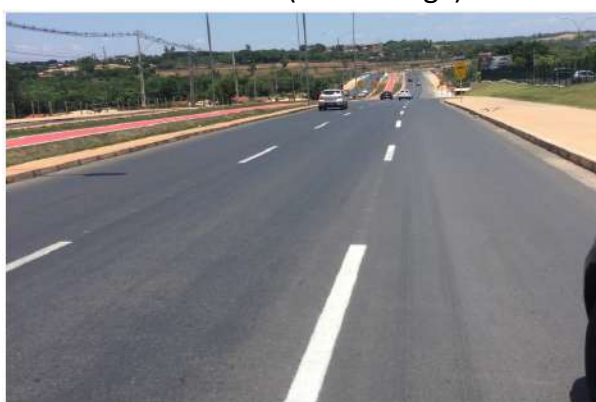
MT-010 (Cuiabá/Avenida Helder Cândia)