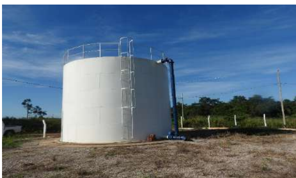
Sistema de Abastecimento de Água (Araputanga)