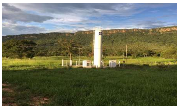
Sistema de Abastecimento de Água (Alto Paraguai)