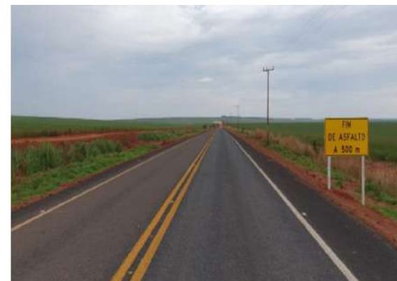
MT-338 (Campos de Júlio)