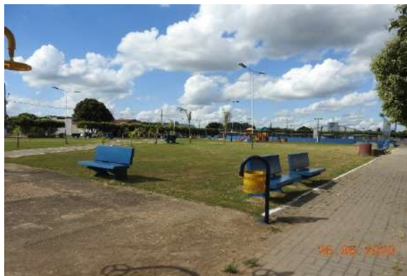
Praça Pública (Guarantã do Norte)