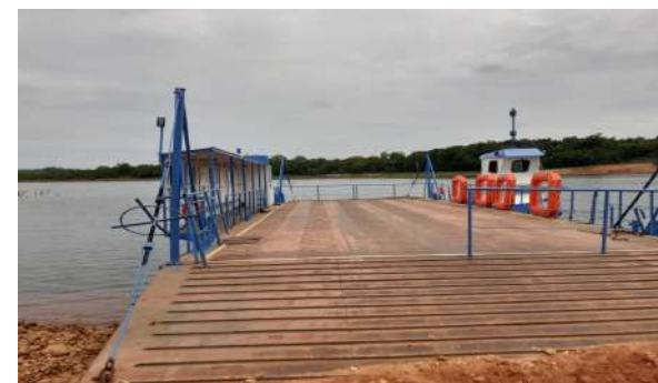
Balsa no Rio Teles Pires (MT-325/Alta Floresta)