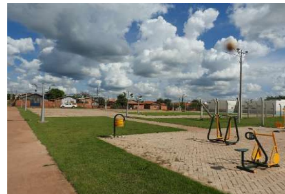
Praça Pública (Jauru)