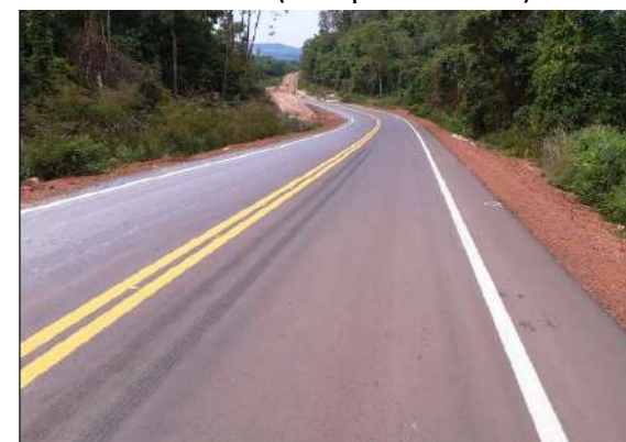
MT-322 (União do Norte)